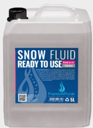
Bidons 2,5L – 5L – 10L – 20L 200L -1000L