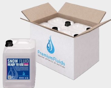
Cartons 6x2,5L – 4x5L