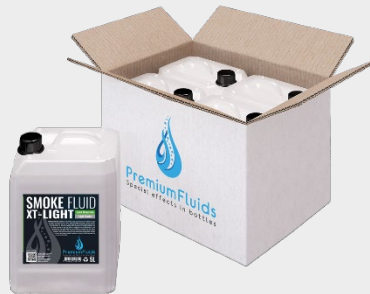
Cartons 6x2,5L – 4x5L