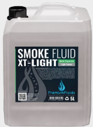
Bidons 2,5L – 5L – 10L – 20L 200L -1000L