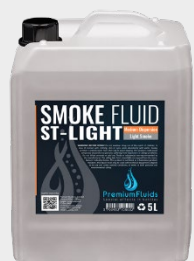
Bidons 2,5L – 5L – 10L – 20L 200L -1000L