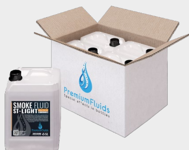
Cartons 6x2,5L – 4x5L