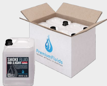
Cartons 6x2,5L – 4x5L