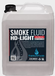
Bidons 2,5L – 5L – 10L – 20L 200L -1000L