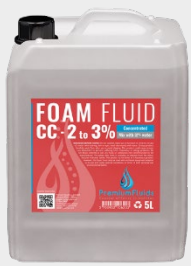
Bidons 2,5L – 5L – 10L – 20L 200L -1000L