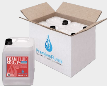
Cartons 6x2,5L – 4x5L