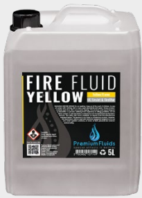
Bidons 2,5L – 5L – 10L – 20L 200L -1000L