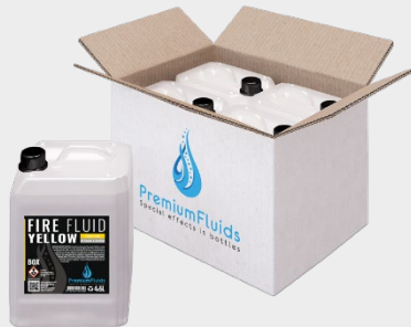
Cartons 6x2,5L – 4x5L