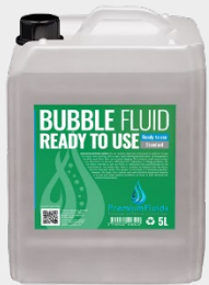
Bidons 2,5L – 5L – 10L – 20L 200L -1000L