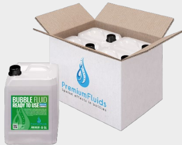
Cartons 6x2,5L – 4x5L